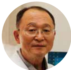
たつの市病院院長 三村 令児